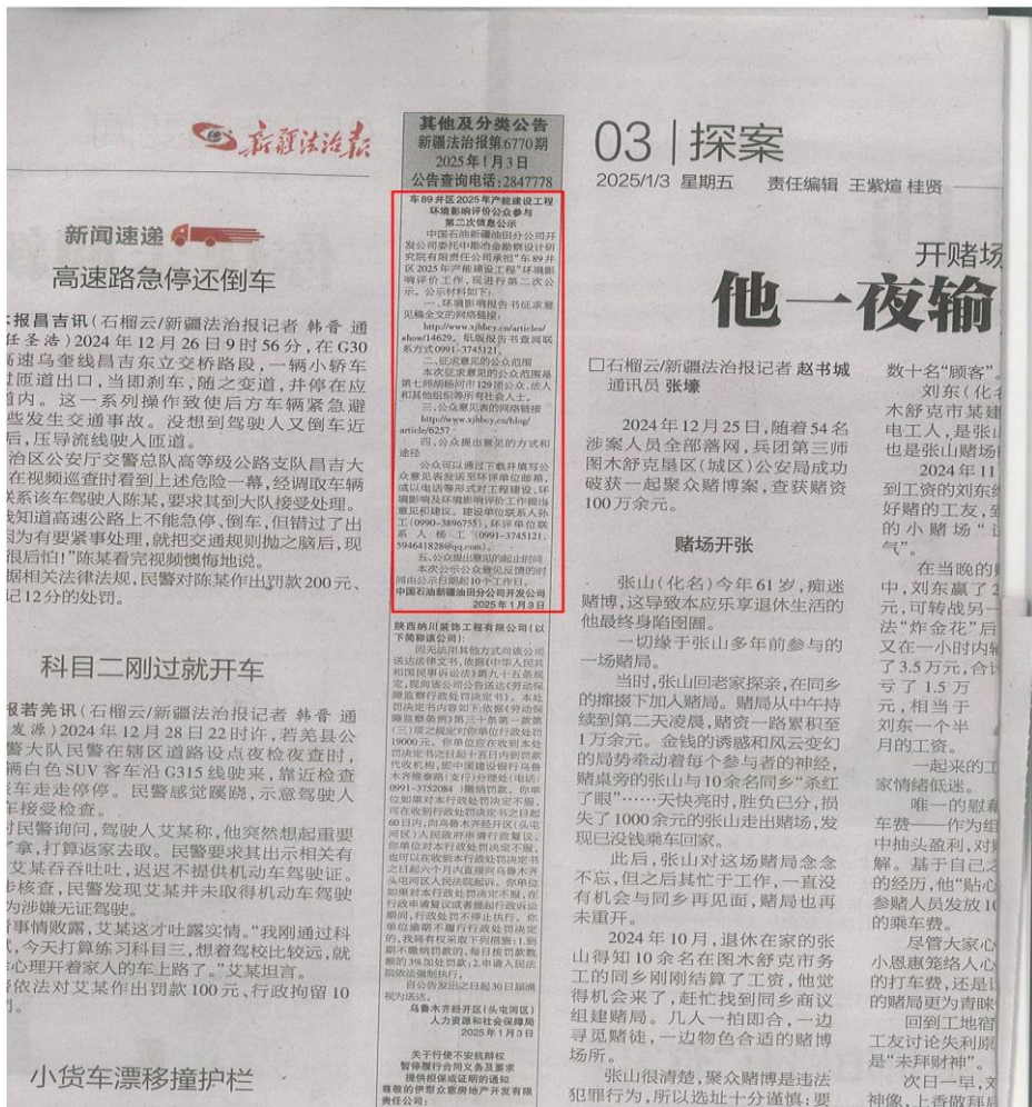
图 3-3 征求意见稿第二次报纸公示截图