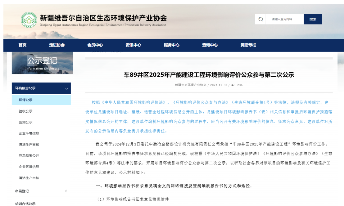
图 3-1 项目第二次公众参与公示截图

中国石油新疆油田分公司开发公司于2024年12月03日在新疆维吾尔自治区生态环境保护产业协会网站刊登了项目第二次公众参与公示信息（ http://www.xjhbcy.cn/articles/show/14629 ），载体选择符合《环境影响评价公众参与办法》要求。公示截图详见图3-1。