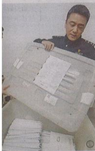
图①:民警展示电信诈骗团伙于体罚的水管。图②:民警展示(资料图)

环境影响评价公众参与第二次公示 我公司委托乌鲁木齐市白塔街环评检测有限公司编制的《哈密市巴里坤县工业园区三德源项目环评影响报告书》(征求意见稿)已完成,现进行环境影响评价公示;请公众在10个工作日内提出相关的意见和建议。征求意见稿链接 http://www.shibey.cn/articles/show/14579 公众意见链接 http://www.shibey.cn/blog/articles/42577