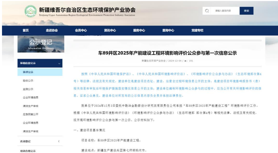
图 2-1 项目第一次公众参与公示截图